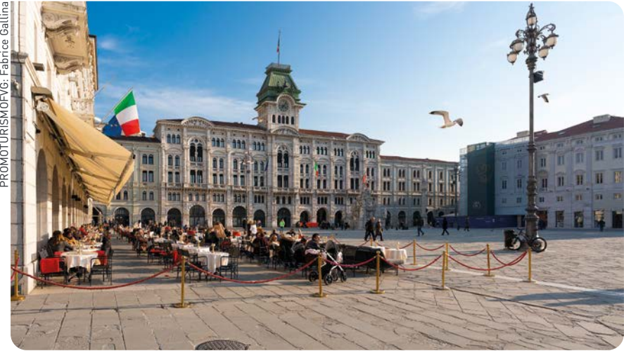
Entre palacios, luz y mar: la magia de la Piazza Unità d'Italia, en Trieste

“Friuli Venezia Julia, la región italiana con el mayor nivel de incentivos a la inversión foránea”