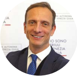
Massimiliano Fedriga Presidente, Friuli Venezia Julia