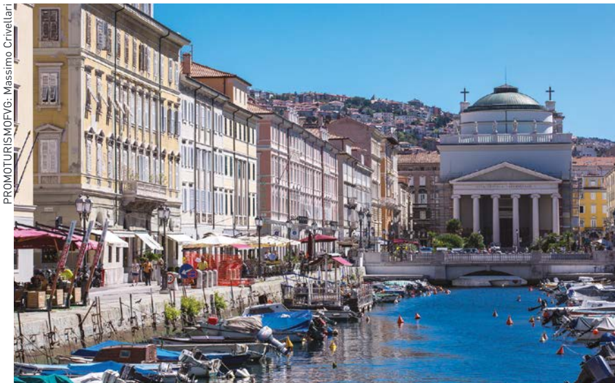
El Gran Canal y la Iglesia de Sant'Antonio Nuovo, en Trieste

La logística sigue siendo un área de fuerte dinamismo, gracias al papel del Puerto de Trieste y a la red intermodal que integra carretera, ferrocarril