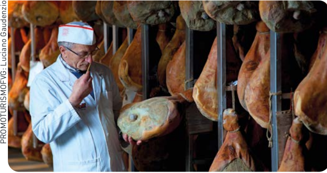
Curación artesanal de prosciutto de San Daniele