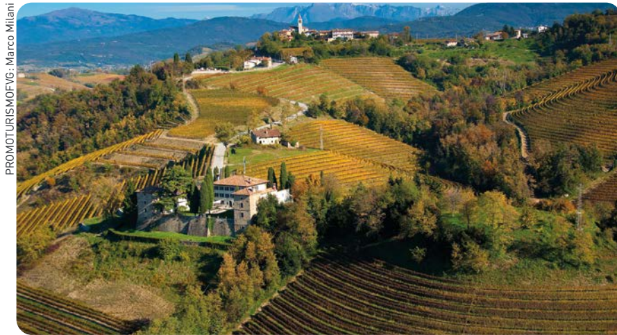
Los viñedos no solo producen vinos excepcionales, sino que también ofrecen experiencias turísticas inolvidables.

En otras partes de Italia, las administraciones municipales son financiadas y reguladas por Roma; en Friuli Venezia Giulia, en cambio, tanto la financiación como la competencia legislativa son regionales. Este modelo permite a las autoridades locales responder con mayor rapidez y eficacia a las necesidades de los ciudadanos.