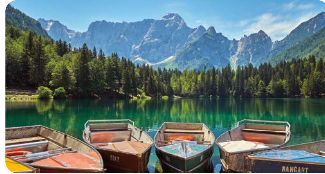
Lagos Fusine en los Alpes Julianos